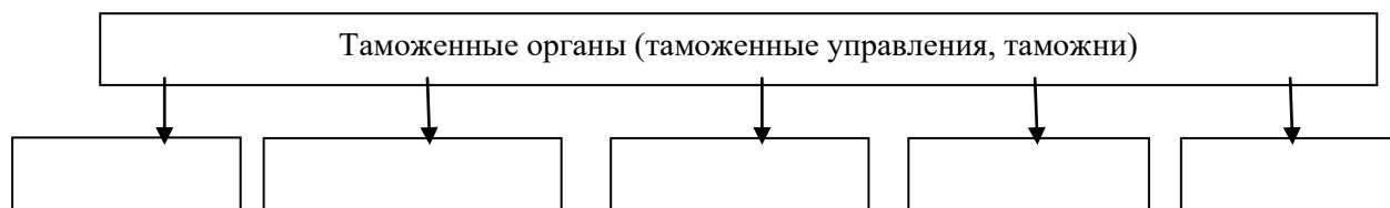
Рис. Документы, издаваемые таможенными управлениями, таможнями.

Согласно типовой инструкции по делопроизводству и работе архива в таможенных органах в зависимости от своей компетенции таможенные органы имеют право издавать различные виды документации . Дополните схему названием документов