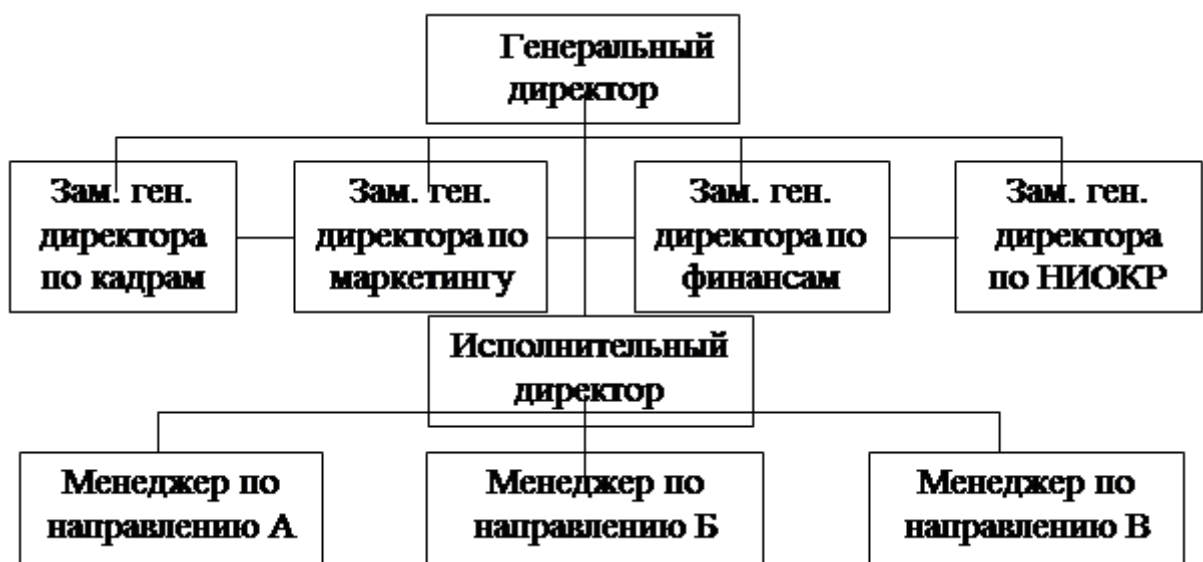
Рис.5. Дивизиональная структура управления