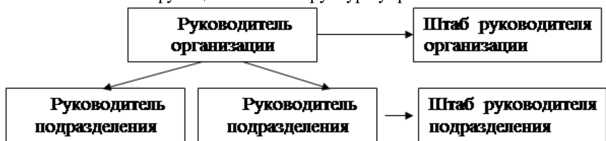
Рис. 4. Линейно-штабная структура управления