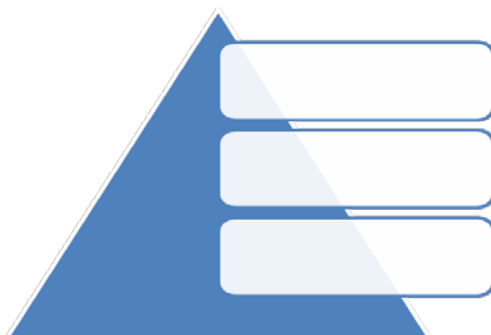
Рис. – Уровни управления в организации