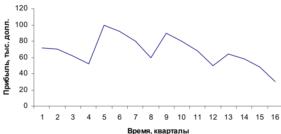
Рис. 1. Динамика прибыли предприятия

График временного ряда (рис. 1.) свидетельствует о наличии сезонных колебаний (период колебаний равен 4) и общей убывающей тенденции уровней ряда. Прибыль компании в весенне-летний период выше, чем в осенне-зимний период. Поскольку амплитуда сезонных колебаний уменьшается, можно предположить существование мультипликативной модели. Определите ее компоненты и получите прогнозные значения прибыли на первое полугодие пятого года.