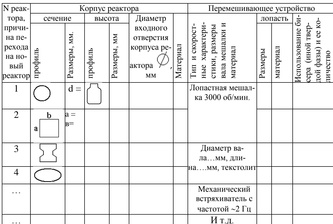
Таблица 1 – Характеристики используемых в работе реакторов

Эта таблица предваряет весь цикл исследований, располагается впереди и заполняется постепенно по мере смены реактора, типа перемешивания в нем, замены корпуса по причине его разрушения или смены материала (стекла на пластик, металл и т.д.) и т.д. Желательно после соответствующего номера указывать дату и причину (плановое исследование, разрушение корпуса, замена лопасти мешалки, смена вала мешалки и т.д.). Следовательно, конец заполнения данной таблицы совпадает с завершением исследований по конкретной тематике.