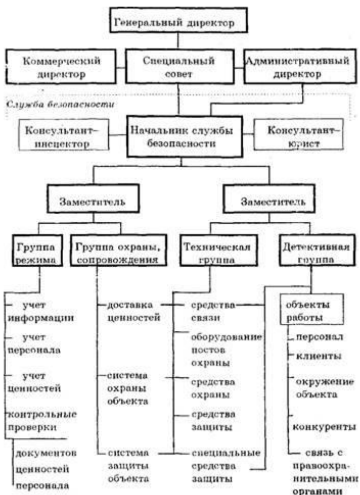
Рис. 2 – Структуры службы безопасности