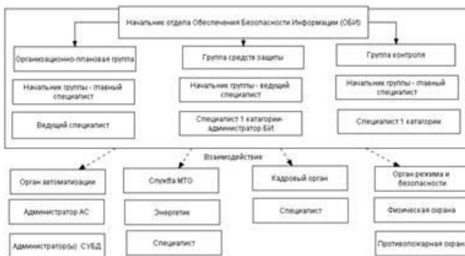
Рис. 1 – Отдел информационной безопасности

7) взаимодействие с правоохранительными органами по вопросам безопасности персонала и имущества объекта.