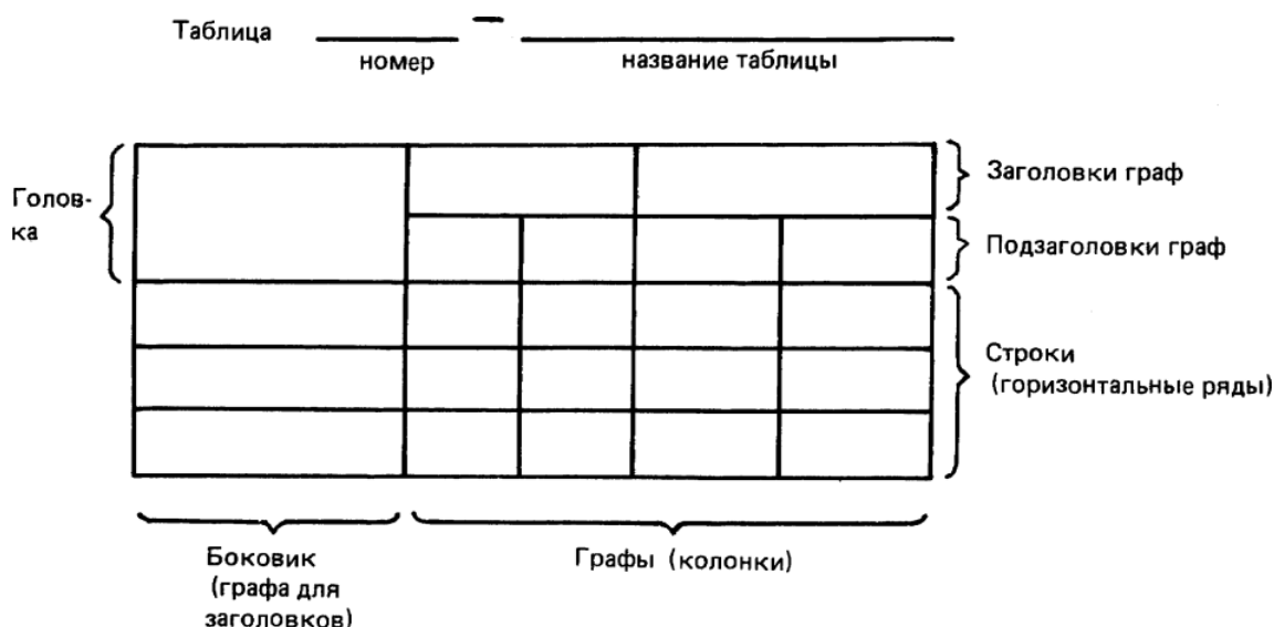
Рисунок 1 - Пример оформления таблиц

Цифровой материал, как правило, оформляется в виде таблицы в соответствии с рисунком 1. Горизонтальные линии, разграничивающие строки таблицы, допускается не проводить, если их отсутствие не затрудняет пользование таблицей. Высота строк таблицы должна быть не менее 8 мм.