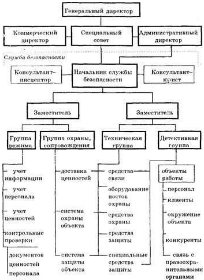
Рис. 2 – Структуры службы безопасности