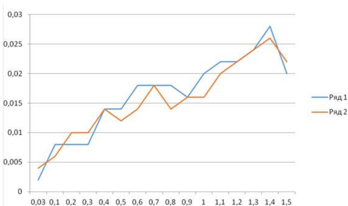
Рисунок 2 – Абсолютная погрешность аналогового прибора при движении стрелки вверх по шкале и вниз, В

Если рисунок взят из первичного источника без авторской переработки, следует сделать ссылку на источник.