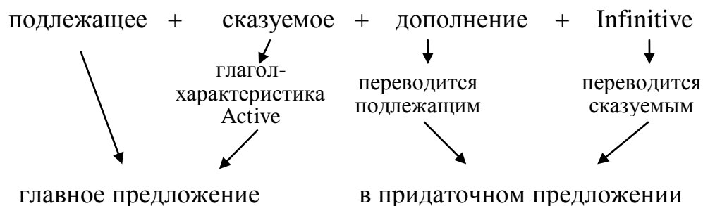
Рис. 4. Порядок слов в предложении с оборотом «дополнение с инфинитивом»

Предложение с таким оборотом имеет следующий порядок слов (рис. 4)