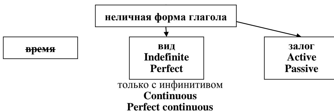
Рис. 1. Характеристики неличных форм глагола

В отличие от личной формы глагола, которая имеет три характеристики (время, вид, залог), неличные формы имеют только две (вид, залог) (Рис. 1).