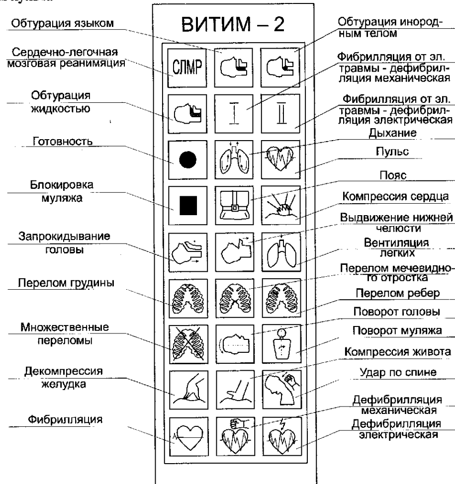
Рис. 2 Функциональные смысловые назначения криптограмм пульта управления

3.1. Отработка программы СЛМР в режиме «1:5» с использованием пульта