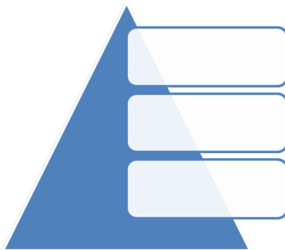
Рис.2. – Уровни управления в организации