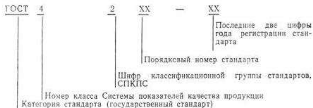
Рисунок 1 – Принцип обозначения стандартов СПКПС

Принцип обозначения стандартов СПКПС представлен на рисунке 1.