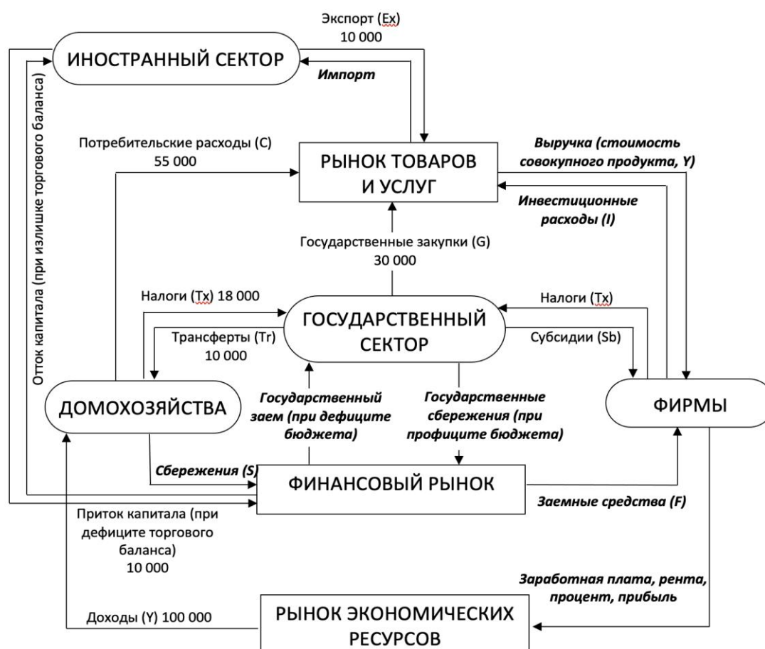
Рис. 1 Схема кругооборота открытой экономики

В схеме кругооборота открытой экономики (рис. 1) рассчитайте недостающие потоки, выделенные жирным курсивом , и проверьте правильность расчетов с помощью основного макроэкономического тождества и тождества «утечек» и «инъекций».