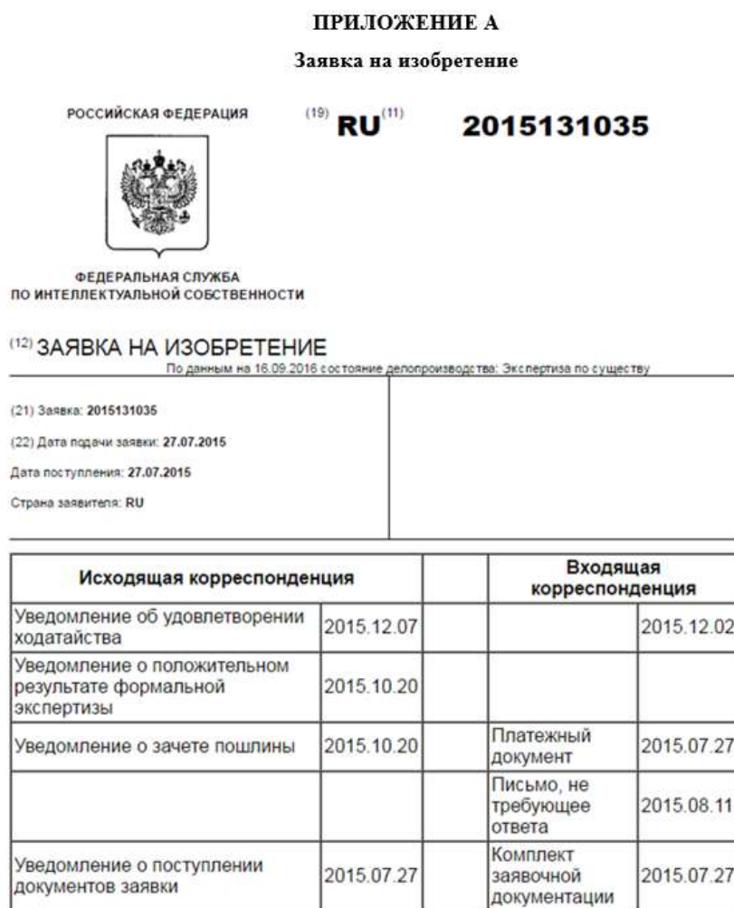
Рисунок 5 – Пример оформления приложения

Каждое приложение следует размещать с новой страницы с указанием в центре верхней части страницы слова «ПРИЛОЖЕНИЕ». Приложение должно иметь заголовок, который записывают с прописной буквы, полужирным шрифтом, отдельной строкой по центру без точки в конце. Приложения обозначают прописными буквами кириллического алфавита, начиная с А, за исключением букв Ё, З, Й, О, Ч, Ъ, Ы, Ь. После слова «ПРИЛОЖЕНИЕ» следует буква, обозначающая его последовательность. Допускается обозначение приложений буквами латинского алфавита, за исключением букв I и O. Если в отчете одно приложение, оно обозначается «ПРИЛОЖЕНИЕ А» [3].