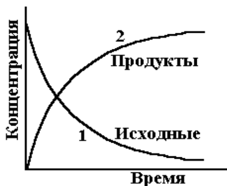
Рис.1. Изменение концентраций реагентов в ходе реакции

Скоростью химической реакции V называют изменение количества реагирующего вещества за единицу времени в единице реакционного пространства.