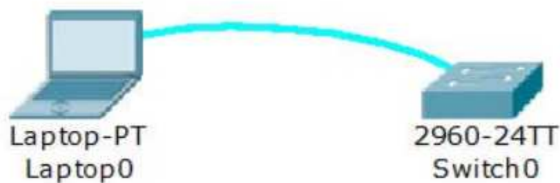
Рисунок 3 – Подключение по консольному кабелю