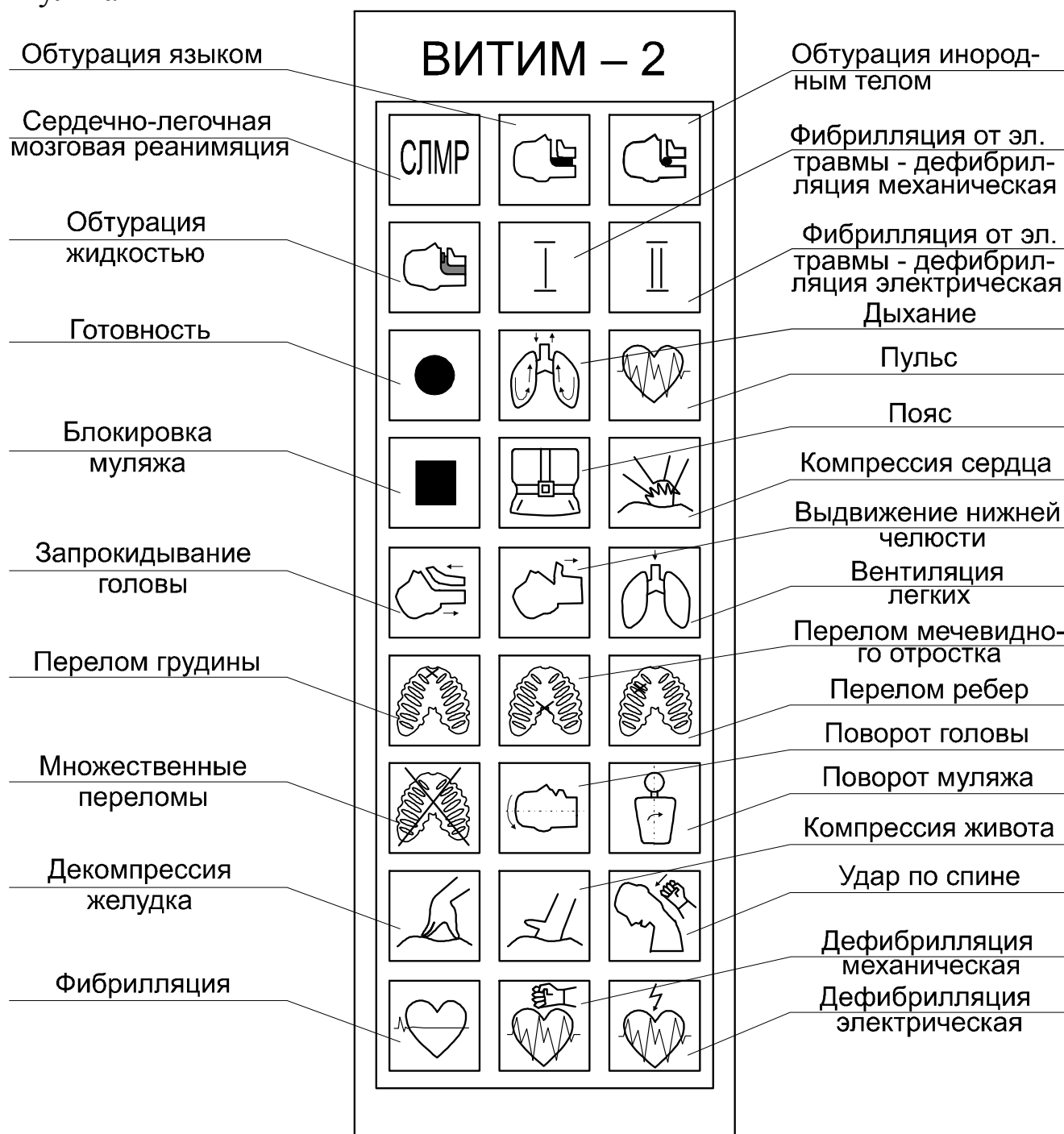
Рис. 2 Функциональные смысловые назначения криптограмм пульта управления

3.1.1. Нажать на пульте управления кнопку «СЛМР», при этом на дисплее имитируется работающее сердце, артериальный кровоток, работающие легкие, кора головного мозга розовая, включена индикация поясного ремня. На индикаторе времени показания «00» (не изменяют-