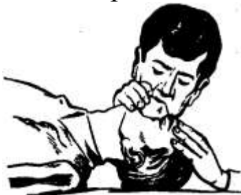
Рисунок 5 – Проведение искусственного дыхания по способу «изо рта в нос»

Если после вдувания воздуха грудная клетка не расправляется, необходимо выдвинуть нижнюю челюсть пострадавшего вперед. Для этого четырьмя пальцами обеих рук захватывают нижнюю челюсть сзади за углы и, упираясь большими пальцами в ее край ниже углов рта, оттягивают и выдвигают челюсть вперед так, чтобы нижние зубы стояли впереди верхних (рис. 4). Если челюсти пострадавшего плотно стиснуты и открыть рот не удастся следует проводить искусственное дыхание «изо рта в нос» (рис. 5).