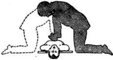
Рисунок 7 – Положение оказывающего помощь при проведении наружного массажа сердца

(отступив на два пальца выше от ее нижнего края), а пальцы приподнимает (рис. 7, рис.8 и рис. 9).