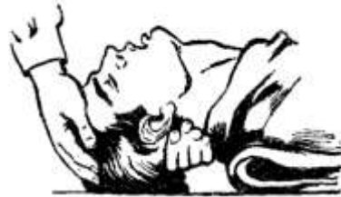
Рисунок 2 – Положение головы пострадавшего при проведении искусственного дыхания