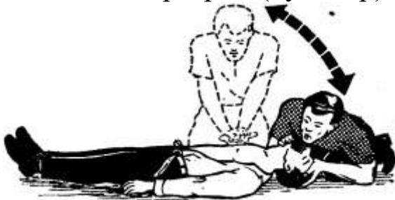
Рисунок 9 – Проведение искусственного дыхания и наружного массажа сердца одним лицом

Ладонь второй руки он кладет поверх первой поперек или вдоль и надавливает, помогая наклоном своего корпуса. Руки при надавливании должны быть выпрямлены в локтевых суставах. Надавливание следует производить быстрыми толчками, так чтобы смещать грудину на 4–5 см, продолжительность надавливания не более 0,5 с, интервал между отдельными надавливаниями 0,5 с. В паузах рук с грудины не снимают, пальцы остаются прямыми, руки полностью выпрямлены в локтевых суставах. Если оживление проводит один человек, то на каждые два вдувания он производит 15 надавливаний на грудину. За 1 мин необходимо сделать не менее 60 надавливаний и 12 вдуваний, т.е. выполнить 72 манипуляции, поэтому темп реанимационных мероприятий должен быть высоким.