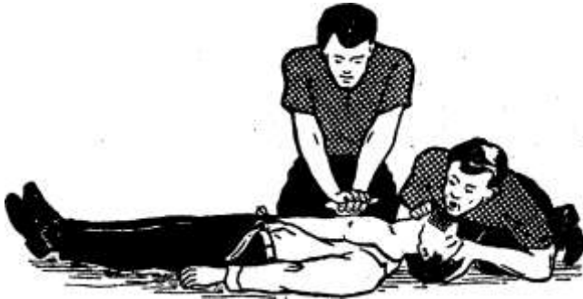
Рисунок 10 – Проведение искусственного дыхания и наружного массажа сердца двумя лицами

Если реанимационные мероприятия проводятся правильно, кожные покровы розовеют, зрачки сужаются, самостоятельное дыхание восстанавливается. Пульс на сонных артериях во время массажа должен хорошо прощупываться, если его определяет другой человек. После того как восстановится сердечная деятельность и будет хорошо определяться пульс, массаж сердца немедленно прекращают, продолжая искусственное дыхание при слабом дыхании пострадавшего и стараясь, чтобы естественный и искусственный вдохи совпали. При восстановлении полноценного самостоятельного дыхания искусственное дыхание также прекращают. Если сердечная деятельность или самостоятельное дыхание еще не восстановились, но реанимационные мероприятия эффективны, то их можно прекратить только при передаче пострадавшего в руки медицинского работника. При неэффективности искусственного дыхания и закрытого массажа сердца (кожные покровы синюшно-фиолетовые, зрачки широкие, пульс на артериях во время массажа не определяется) реанимацию прекращают через 30 мин.