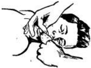
Рисунок 1 – Очищение рта и глотки

Если у пострадавшего хорошо определяется пульс и необходимо только искусственное дыхание, то интервал между искусственными вдохами должен составлять 5 с (12 дыхательных циклов в минуту).