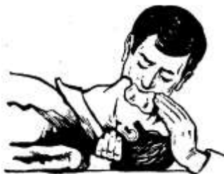
Рисунок 3 – Проведение искусственного дыхания по способу «изо рта в рот»