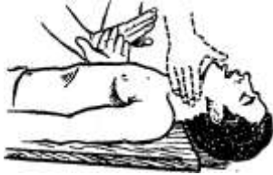
Рисунок 8 – Правильное положение рук при проведении наружного массажа сердца и определение пульса на сонной артерии (пунктир)