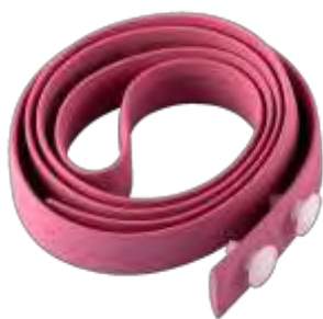
Рисунок 15 – Резиновый жгут для остановки кровотечения