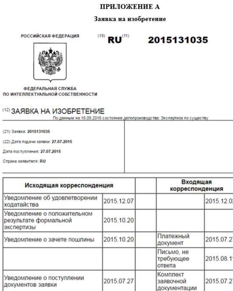
Рисунок 6 – Пример оформления приложения

приложений буквами латинского алфавита, за исключением букв I и O. Если в отчете одно приложение, оно обозначается «ПРИЛОЖЕНИЕ А» [3].