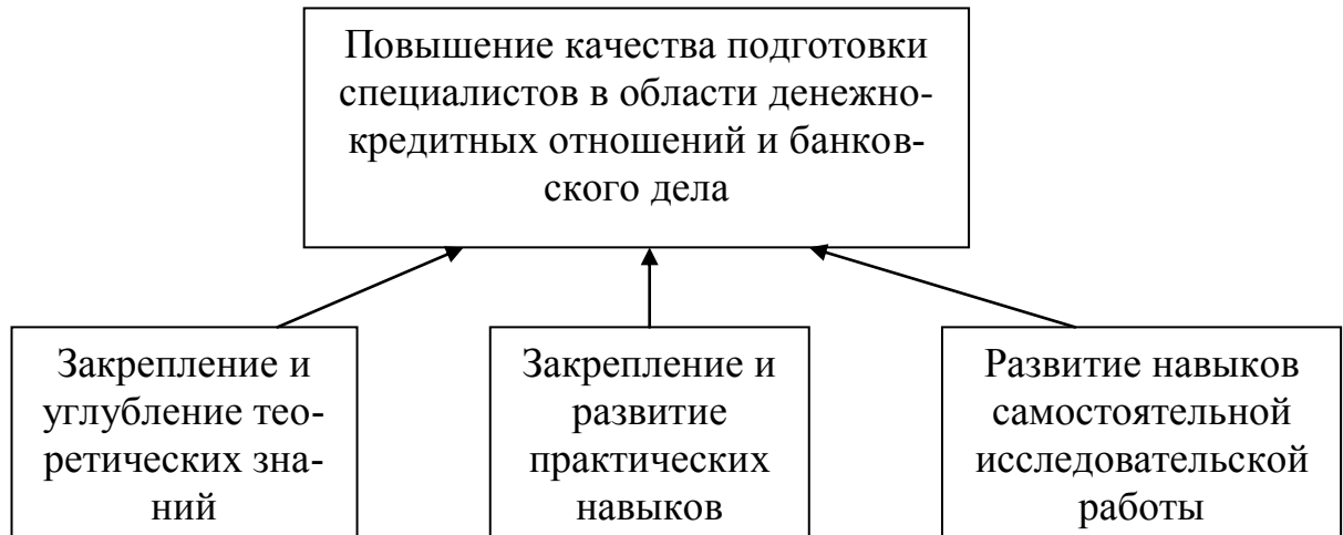
Рисунок 1 – Цель и задачи написания курсовой работы

Основными задачами выполнения курсовой работы по дисциплине «Финансовый менеджмент» являются закрепление знаний, полученных студентами в процессе освоения теоретического курса, а также навыков и умений, приобретенных на практических занятиях (рис. 1).