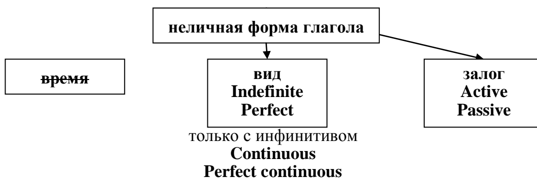
Рис. 1. Характеристики неличных форм глагола

В отличие от личной формы глагола, которая имеет три характеристики (время, вид, залог), неличные формы имеют только две (вид, залог) (Рис. 1).