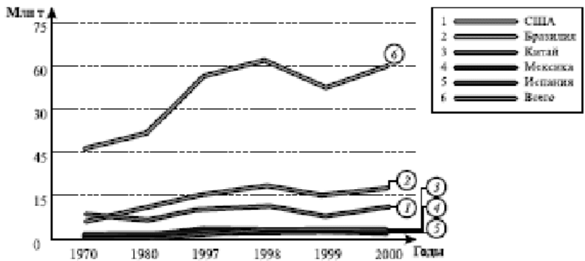
Рисунок 1– Производство апельсинов в мире

В Бразилии и США, главных «апельсиновых» державах мира, в последние годы собирают рекордное количество апельсинов (рис. 1).