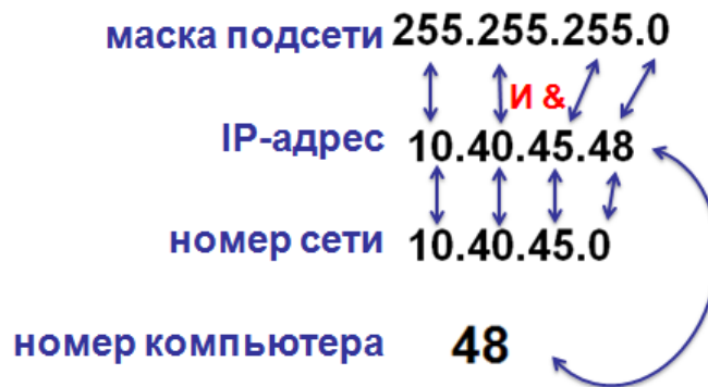
Рис. 2.3. Расчет номера сети по IP-адресу и маске сети

В маске подсети старшие биты, отведенные в IP-адресе компьютера для номера сети, имеют значение 1 (255); младшие биты, отведенные в IP-адресе компьютера для адреса компьютера в подсети, имеют значение 0.