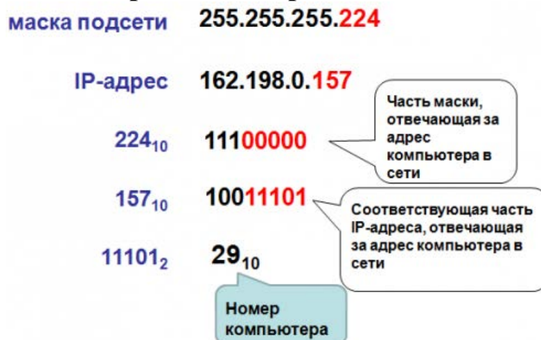
Рис. 2.4. Расчет номера компьютера в сети