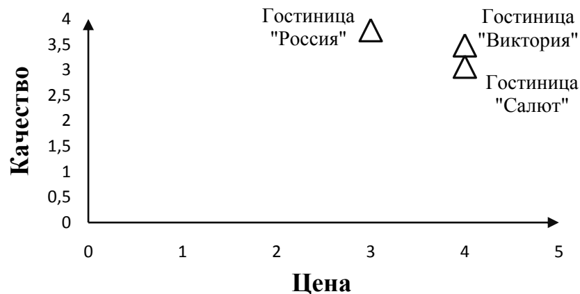
Рисунок 1 – Профиль конкурентоспособности гостиниц с использованием классической пятибалльной шкалы

Данные таблицы 3 позволяют построить профиль конкурентоспособности гостиниц (рис. 1).