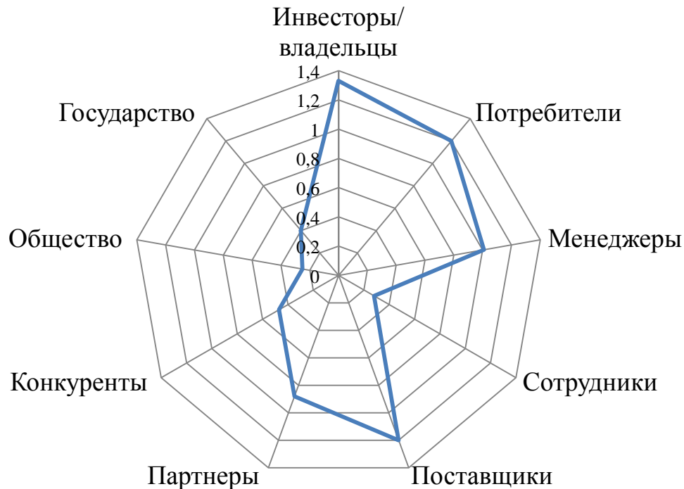
Рисунок 4 – Удовлетворенность заинтересованных сторон деятельностью организации (взвешенные оценки)

На рисунке 4 представлена удовлетворенность заинтересованных сторон деятельностью организации согласно их взвешенной оценки по данным таблицы 19.