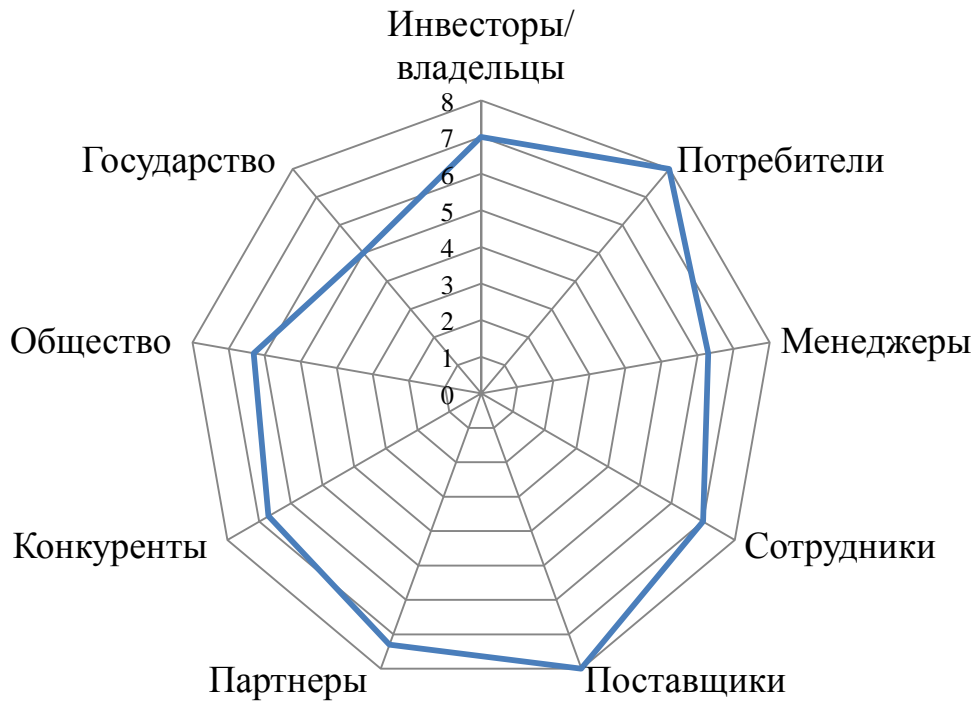
Рисунок 3 – Удовлетворенность заинтересованных сторон деятельностью организации (средние оценки)

рисунке 3 представлена удовлетворенность заинтересованных сторон деятельностью организации согласно их средней оценки по данным таблицы 19.