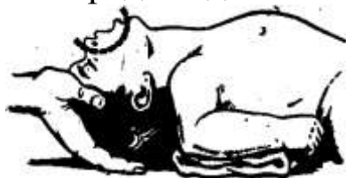
Рис. 6. Проведение искусственного дыхания ребенку

Маленьким детям вдувают воздух одновременно в рот и в нос, охватывая своим ртом и нос ребенка (рис. 6). Чем меньше ребенок, тем меньше ему нужно воздуха для вдоха и тем чаще следует производить вдувание по сравнению со взрослым человеком (до 15–18 раз в минуту). Поэтому вдувание должно быть неполным и менее резким, чтобы не повредить дыхательные пути пострадавшего.