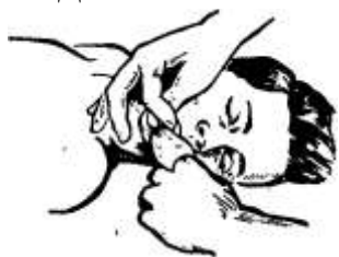
Рисунок 1 – Очищение рта и глотки

Если у пострадавшего хорошо определяется пульс и необходимо только искусственное дыхание, то интервал между искусственными вдохами должен составлять 5 с (12 дыхательных циклов в минуту).