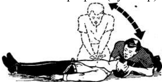
Рисунок 9 – Проведение искусственного дыхания и наружного массажа сердца одним лицом

Ладонь второй руки он кладет поверх первой поперек или вдоль и надавливает, помогая наклоном своего корпуса. Руки при надавливании должны быть выпрямлены в локтевых суставах. Надавливание следует производить быстрыми толчками, так чтобы смещать грудину на 4–5 см, продолжительность надавливания не более 0,5 с, интервал между отдельными надавливаниями 0,5 с. В паузах рук с грудины не снимают, пальцы остаются прямыми, руки полностью выпрямлены в локтевых суставах. Если оживление проводит один человек, то на каждые два вдувания он производит 15 надавливаний на грудину. За 1 мин необходимо сделать не менее 60 надавливаний и 12 вдуваний, т.е. выполнить 72 манипуляции, поэтому темп реанимационных мероприятий должен быть высоким.