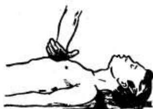
Рисунок 11 – Проведение наружного массажа сердца детям до 12 лет

Реанимационные мероприятия у детей до 12 лет имеют особенности. Детям от года до 12 лет массаж сердца производят одной рукой (рис. 11) и в минуту делают от 70 до 100 надавливаний в зависимости от возраста, детям от года - от 100 до 120 надавливаний в минуту двумя пальцами (вторым и третьим) на середину грудины (рис. 12).