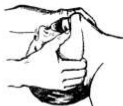
Рисунок 4 – Выдвижение нижней челюсти двумя руками

Кроме расширения грудной клетки хорошим показателем эффективности искусственного дыхания может служить порозовение кожных покровов и слизистых, а также выход больного из бессознательного состояния и появление у него самостоятельного дыхания.