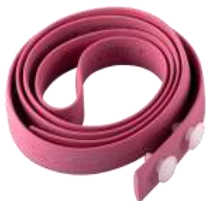
Рисунок 15 – Резиновый жгут для остановки кровотечения