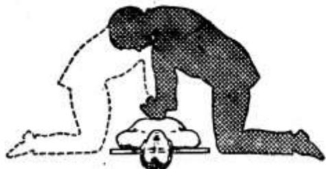
Рисунок 7 – Положение оказывающего помощь при проведении наружного массажа сердца

(отступив на два пальца выше от ее нижнего края), а пальцы приподнимает (рис. 7, рис.8 и рис. 9).