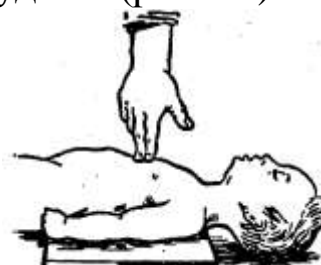
Рисунок 12 – Проведение наружного массажа сердца новорожденным и детям в возрасте до одного года