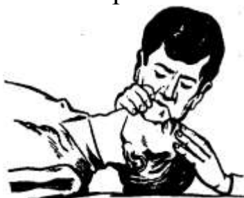
Рисунок 5 – Проведение искусственного дыхания по способу «изо рта в нос»

Если после вдувания воздуха грудная клетка не расправляется, необходимо выдвинуть нижнюю челюсть пострадавшего вперед. Для этого четырьмя пальцами обеих рук захватывают нижнюю челюсть сзади за углы и, упираясь большими пальцами в ее край ниже углов рта, оттягивают и выдвигают челюсть вперед так, чтобы нижние зубы стояли впереди верхних (рис. 4). Если челюсти пострадавшего плотно стиснуты и открыть рот не удастся следует проводить искусственное дыхание «изо рта в нос» (рис. 5).