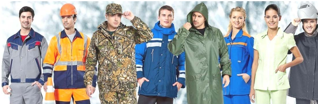
Рис. 4. Одежда специальная защитная

Маркировка спецодежды осуществляется с помощью эмблем, которые прикрепляют к верхней части левого рукава или нагрудному карману.