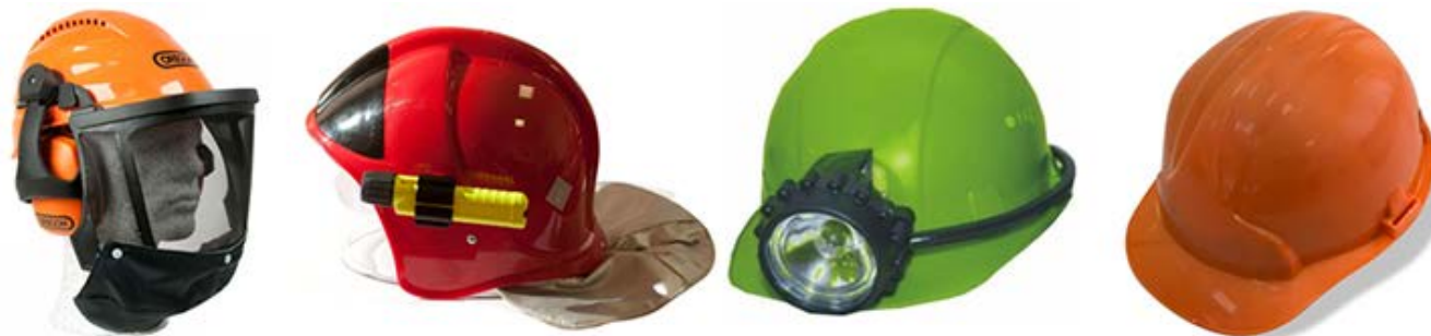
а) каски защитные