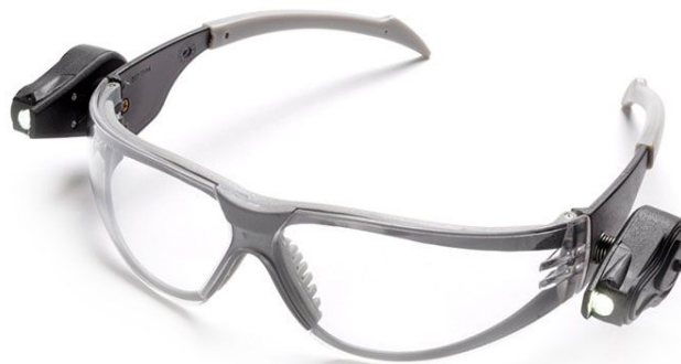
Очки защитные открытые 3M LED Light Vision, 2 LED фонаря, прозрачные