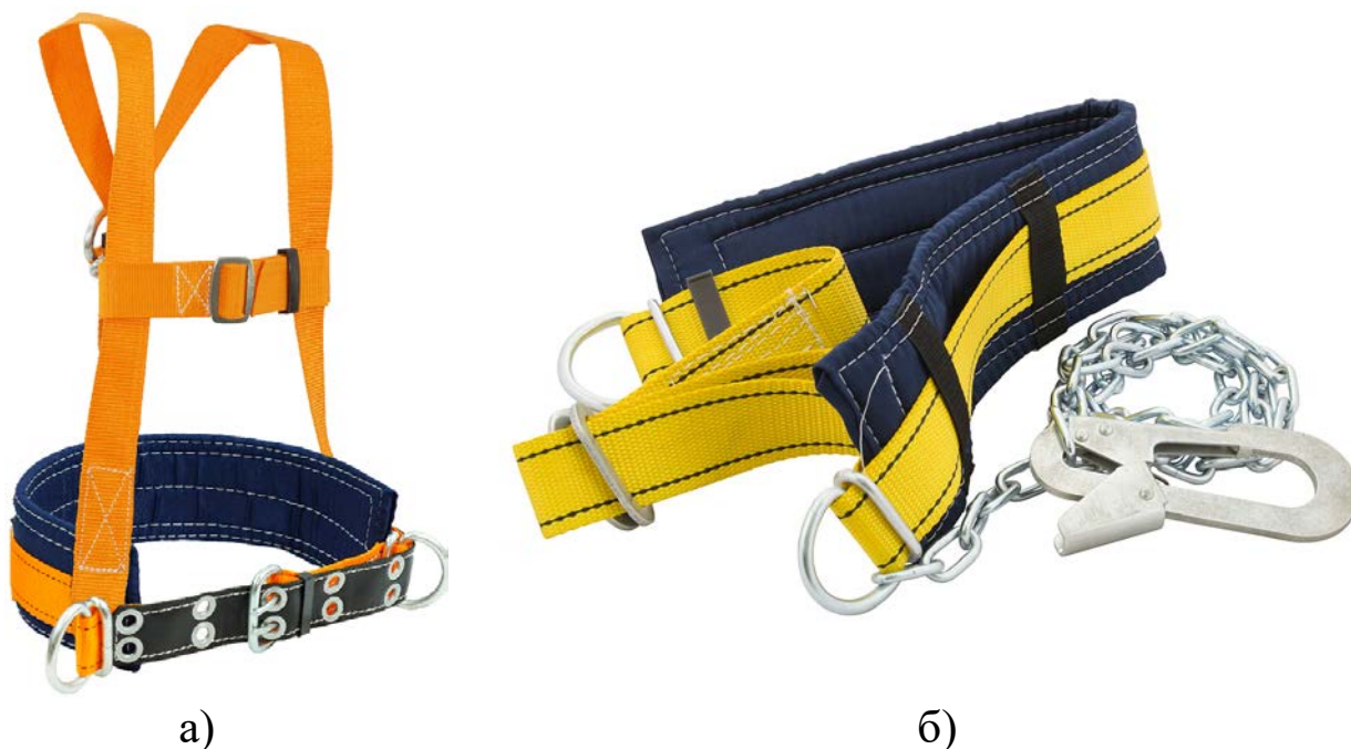
Рис. 12. Пояс предохранительный строительный с наплечными лямками (а) и безлямочный со стропом из металлической цепи (б)

10. Средства защиты от падения с высоты и другие предохранительные средства: предохранительные пояса, тросы; ручные захваты, манипуляторы; наколенники, налокотники, наплечники.