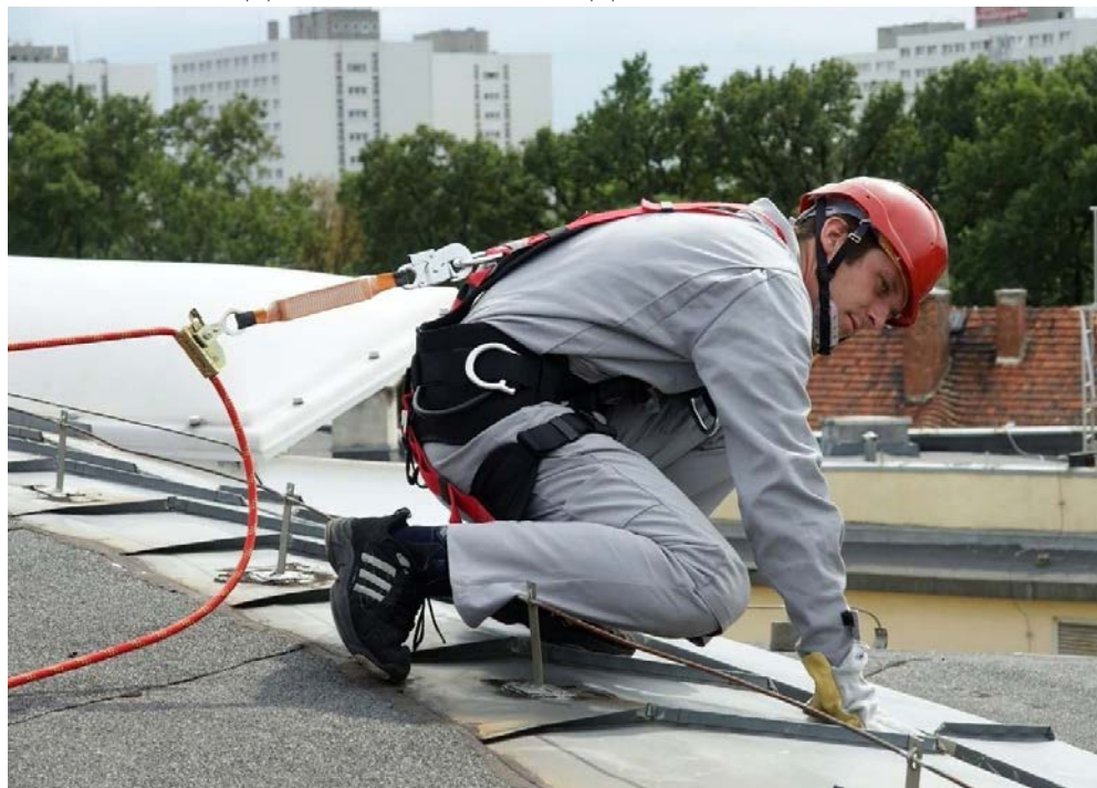
Рис. 13. Удерживающая система

Они состоят из регулируемого или нерегулируемого по длине удерживающего стропа (карабина), анкерного устройства (горизонтальная анкерная линия), страховочной привязи. Удерживающие системы нельзя использовать для остановки падения.