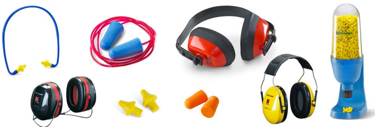
Рис. 11. Средства защиты органа слуха

По назначению и конструкции средства индивидуальной защиты органа слуха подразделяются на три вида: наушники, закрывающие ушную раковину, вкладыши, перекрывающие наружный слуховой канал, шлемы, закрывающие часть головы и ушную раковину.