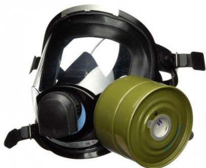
Рис. 15. Противогаз МЗС ВК 450, маска МАГ-3Л, Экран защитный.

Предназначен для использования в качестве средства индивидуальной защиты органов дыхания, лица и глаз в условиях химического, биологического заражения и радиоактивного загрязнения.