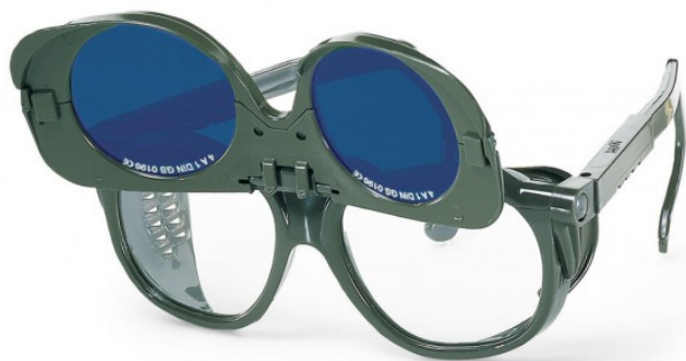
Очки открытые для газосварщика Uvex с двойными линзами