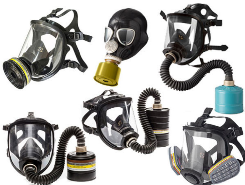
Противогазы промышленные фильтрующие

Пневмошлем ЛИЗ-5 предназначен для защиты головы и органов дыхания от высокотоксичных и радиоактивных веществ