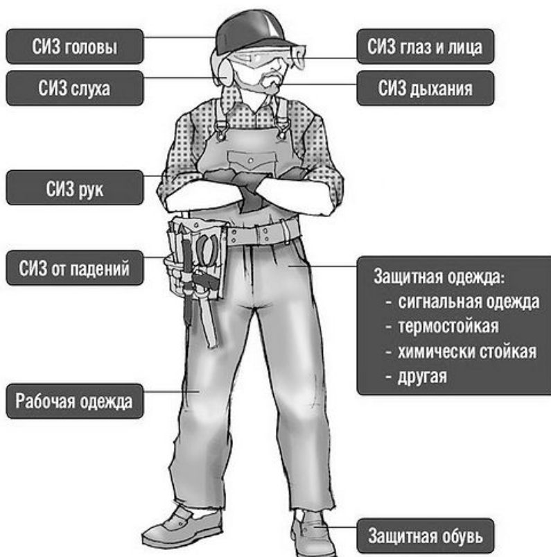
Рис. 1. Классификация СИЗ по назначению

Основной критерий, по которому классифицируются СИЗ, – это их назначение. Защищать можно разные человеческие органы и части тела (рис. 1).