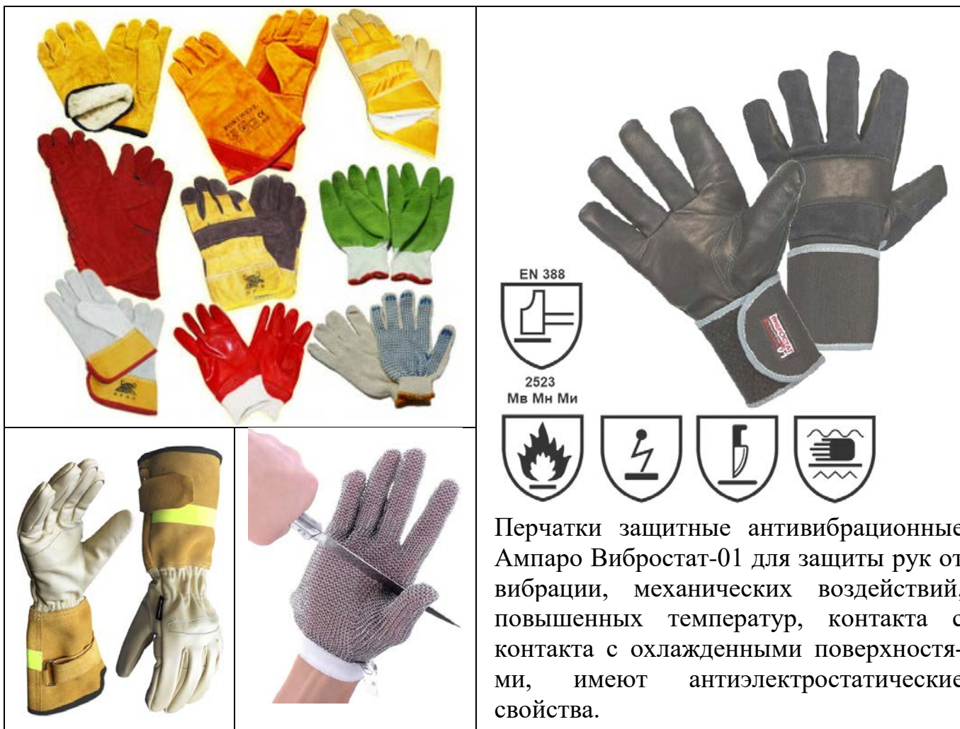
Рис. 6. Средства защиты рук

Спилковые перчатки защищают от повышенных температур, искр и брызг расплавленного металла, теплового излучения, контакта с раскаленными поверхностями. Они необходимы металлургам, сталеварам, пожарным и сварщикам.