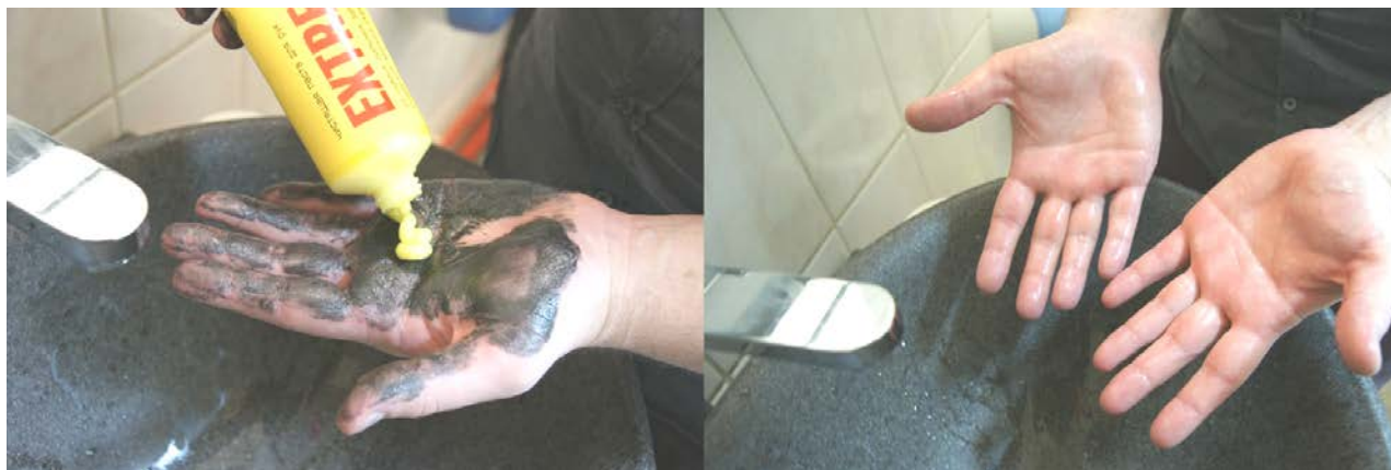
Рис. 14. Нанесение пасты для очистки рук от мазута

нии работы. Как правило, защитные пасты и мази наносят на кожу дважды в течение смены.