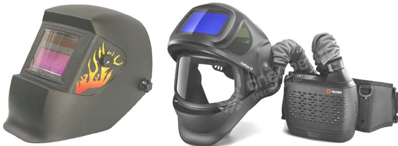
а) маска сварщика «Хамелеон»