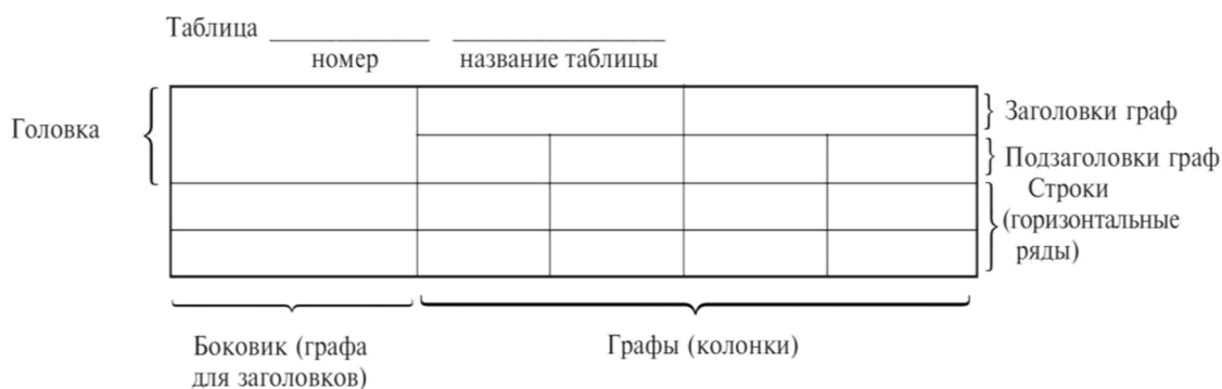
Рисунок 1- Пример оформления таблицы

Таблицы, за исключением таблиц приложений, следует нумеровать арабскими цифрами сквозной нумерацией. Допускается нумеровать таблицы в пределах раздела. В этом случае номер таблицы состоит из номера раздела и порядкового номера таблицы, разделенных точкой.