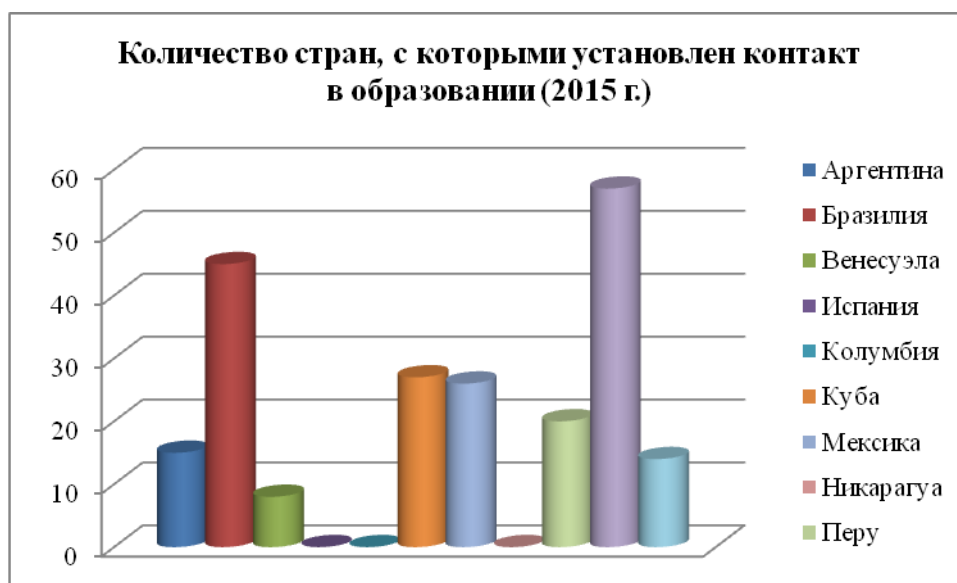
Рисунок 1 - Количество стран, с которыми установлен контакт в образовании