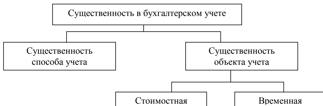
Рисунок 3 - Категория существенности при формировании учетной политики