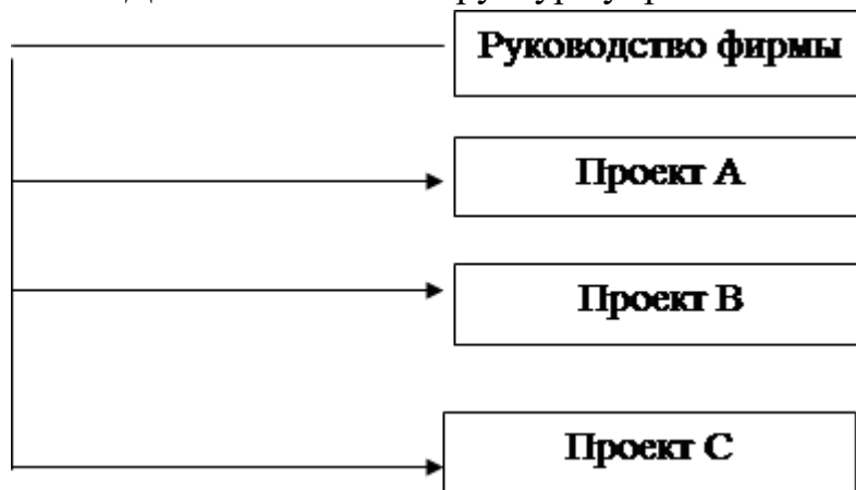
Рис. 6. Проектная структура управления

Задание № 4. Выберите те признаки, которые присущи государственному управлению: