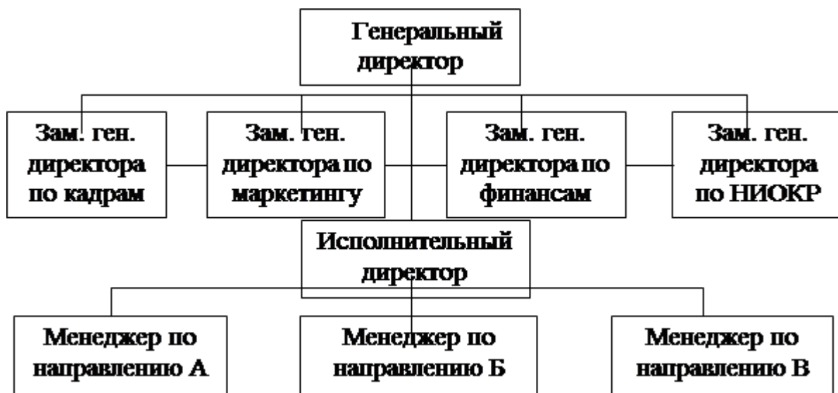
Рис.5. Дивизиональная структура управления