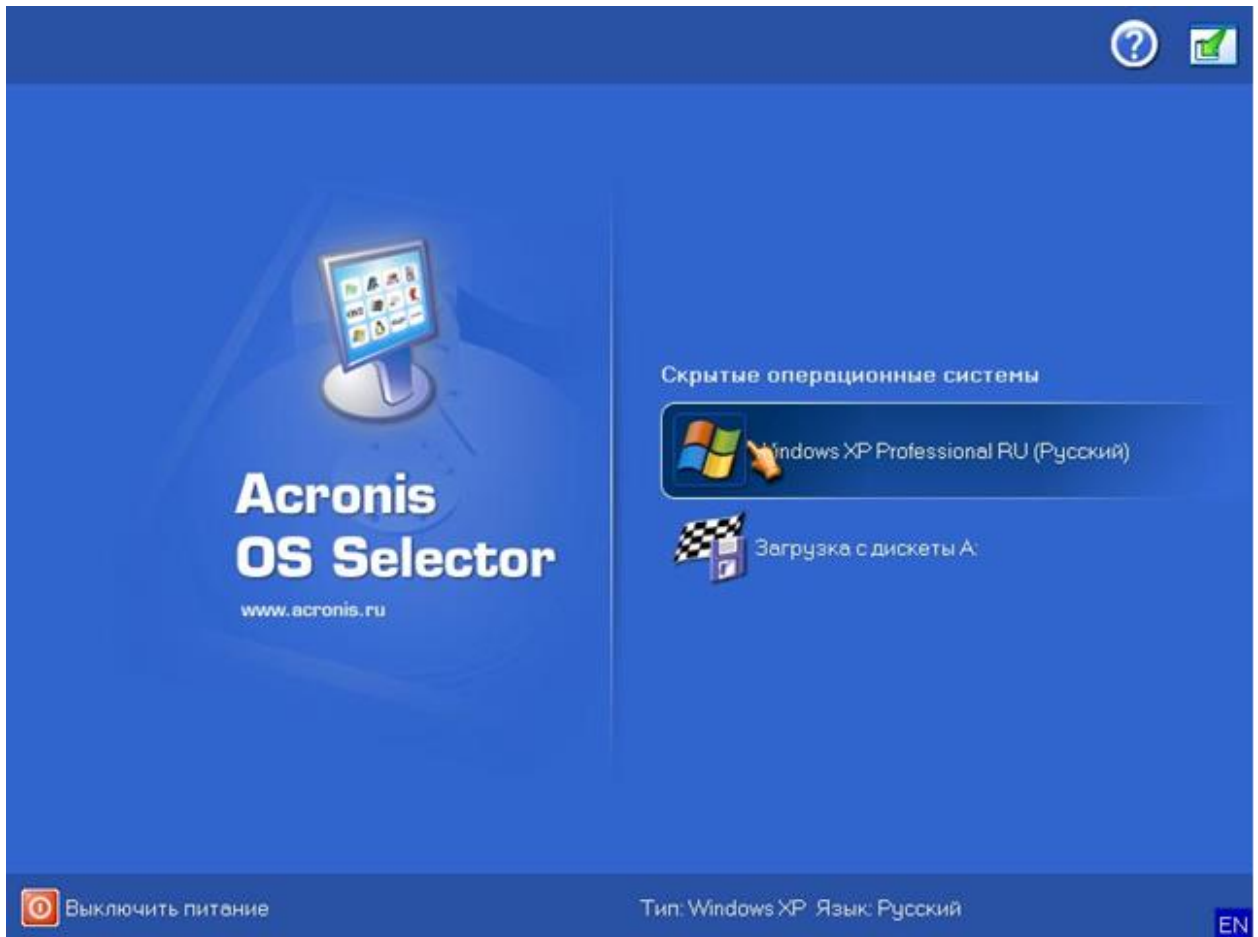
Рис. 3 - Acronis OS Selector

Эта утилита позволяет установить несколько операционных систем на компьютер под управлением Windows XP или более новой версии (включая Windows 7). Загрузка операционной системы может выполняться с любого раздела на любом диске, либо вы можете разместить несколько ОС в одном разделе. Этот инструмент легко использовать и он работает очень быстро.