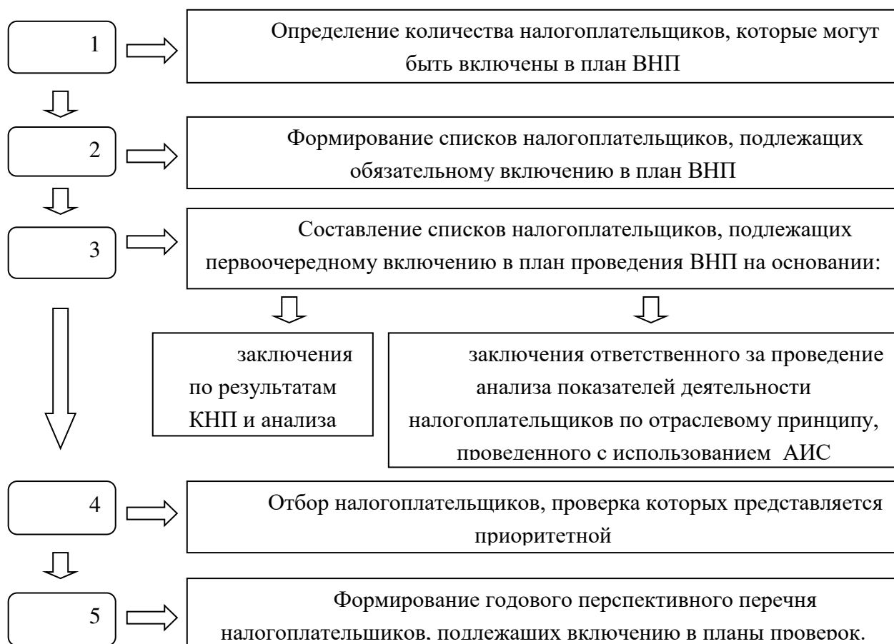
Рисунок 1 – Этапы планирования выездной налоговой проверки